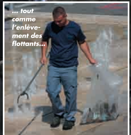
... tout comme l'enlève- ment des flottants...