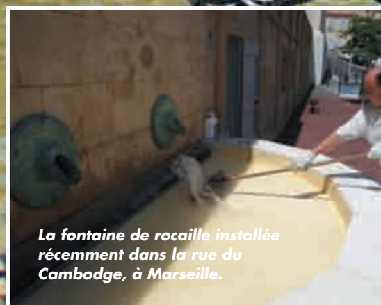
La fontaine de rocaille installée récemment dans la rue du Cambodge, à Marseille.