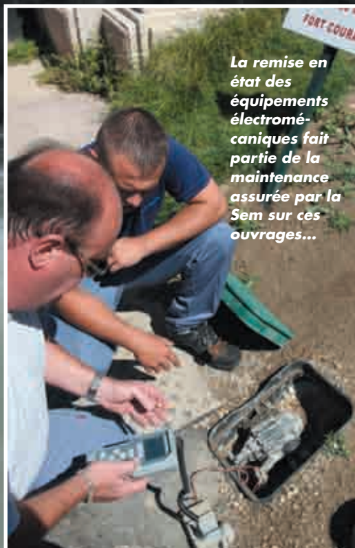
La remise en état des équipements électromé- caniques fait partie de la maintenance assurée par la Sem sur ces ouvrages...