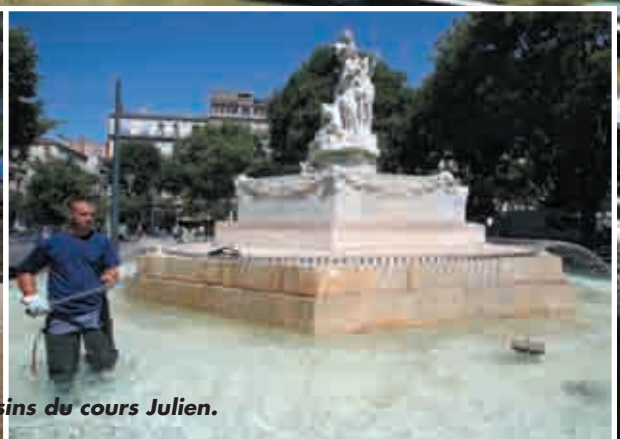
Entretien des bassins du cours Julien.