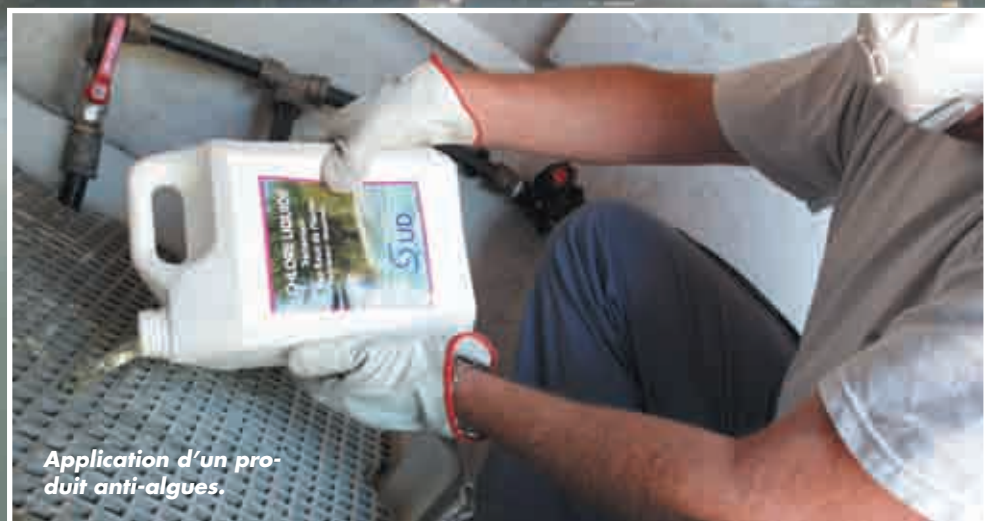
Application d'un produit anti-algues.

Ce soin particulier nécessite l'intervention de deux agents. Et dure de deux à trois jours, pour les grandes fontaines, d'une demi-journée à un jour pour celles dont la taille est plus réduite. C'est à ce prix, aussi, que les places des III quartiers de Marseille prennent toute leur vie.