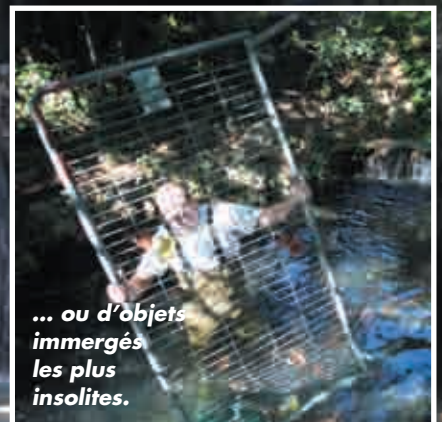
... ou d'objets immergés les plus insolites.